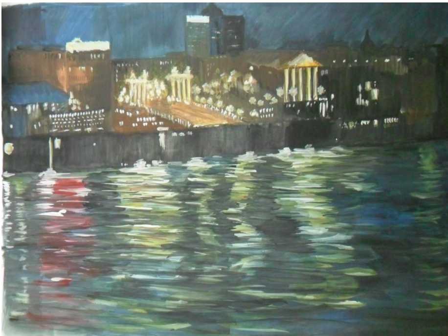
«Огни ночного Волгограда», гуашь