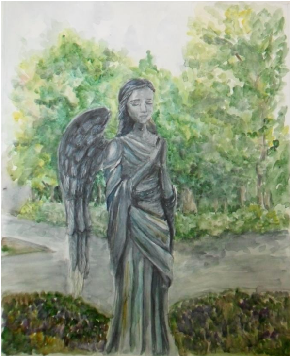
«Ангел моего города», акварель

для участия в городском конкурсе по изобразительному искусству пленэрных работ «Волгоград – Родина, отечество - Россия»