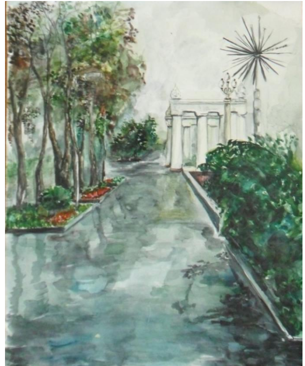
«Набережная – любимое место волгоградцев», акварель